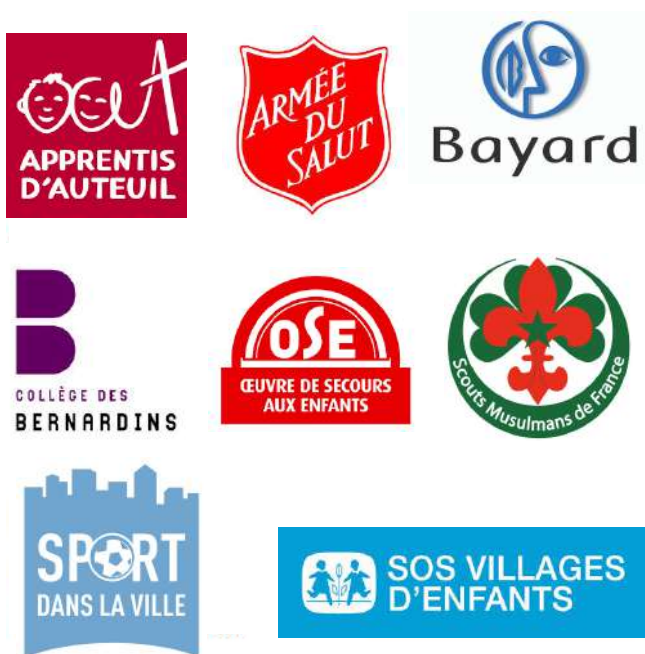
Les membres fondateurs et partenaires

VERS LE HAUT diffuse des propositions concrètes pour construire un projet éducatif adapté aux défis du 21ème siècle et mobilisant l'ensemble du corps social.