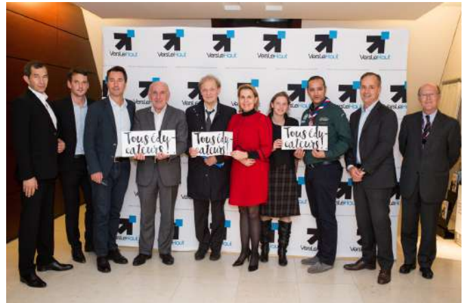
Le Comité Directeur au lancement de Vers Le Haut en novembre 2015.

Une équipe avec 3 salariés qui assurent la coordination des recherches, la rédaction et la diffusion des publications ainsi que l'organisation des rencontres.